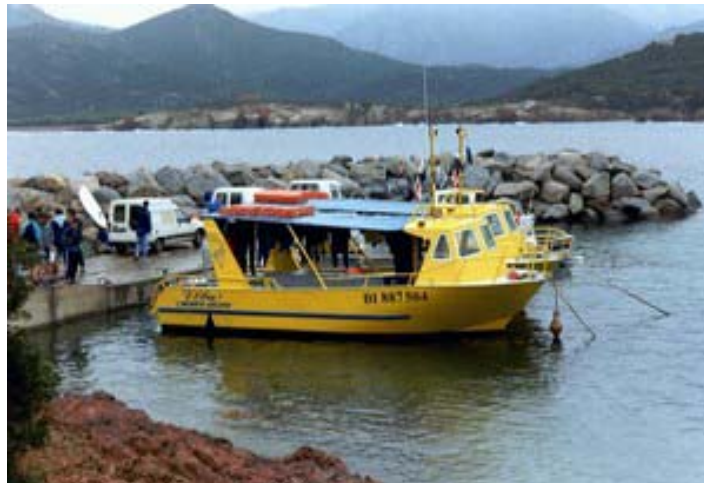
Une sortie club en Corse à Galéria.

Ces différents points sont très importants car la moindre variation de profondeur ou de durée de plongée, peut entraîner des paliers différents.